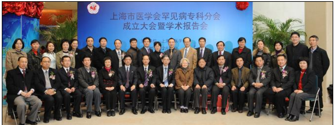
上海市医学会罕见病专科分会第一届委员会与出席会议的领导合影。