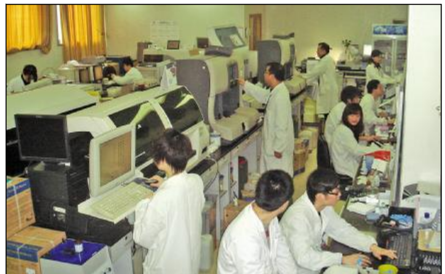
检验科快速反应实验室

POCT(床旁检测)——危急项目床旁操作,为抢救赢得宝贵时间。 血气、电解质检验是临床急救和监护病人的一项重要重要的实验室检测项目,对呼吸衰竭和酸碱平衡紊乱病人的诊断治疗起着关键的作用。(下转第5版)