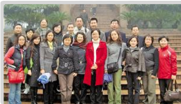
上海交通大学先进党支部 儿内支部