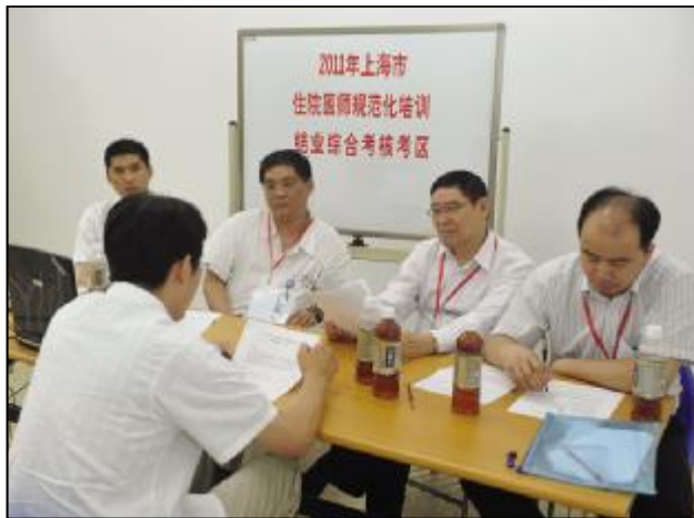
学员们进行病例分析答辩

根据《上海市住院医师规范化培训结业综合考核要求》,各学科均以考核住院医师的临床思维和临床技能为主,考核形式分为六项,依次为综合知识、X线读片和心电图诊断、病例分析、病史采集、体格检查、临床操作技能。其中,前两项为集中上机考试,后四项在联席会议办公室指定的各考区进行。