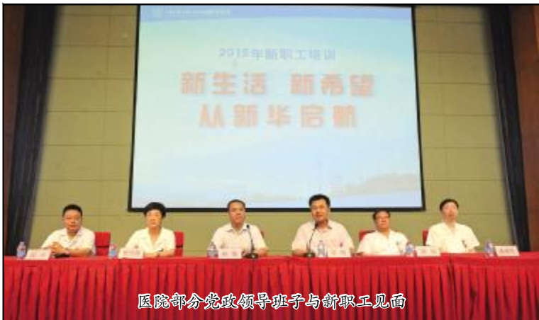
医院部分党政领导班子与新职工见面