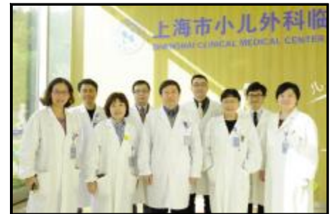
▲儿童肿瘤联合门诊