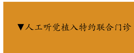
▼人工听觉植入特约联合门诊