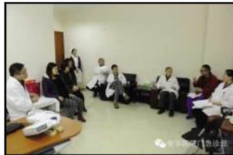
▲胎儿先天性心脏病联合门诊

联合门诊其实是病人接受系统诊治的开始，不同的阶段，不同的学科接力，从初诊到康复，实现一站式全程疾病的管理。