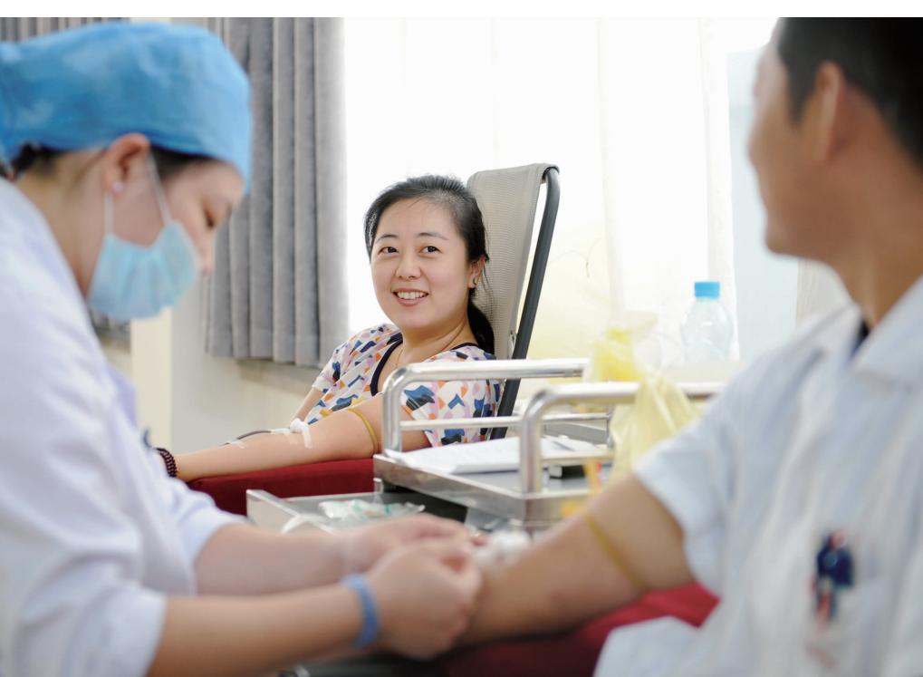
天使夫妻同献血