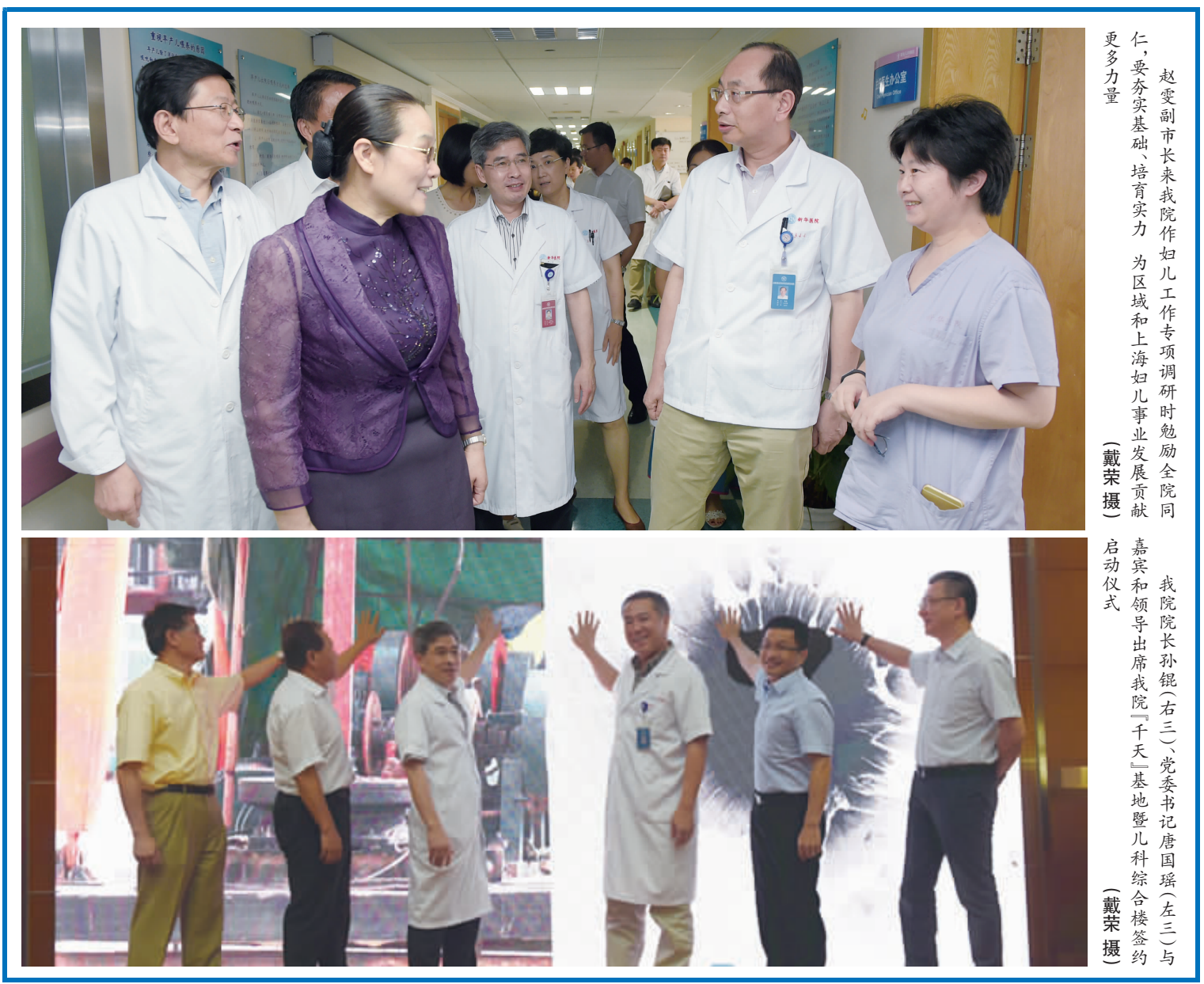
赵雯副市长来我院作妇儿工作专项调研时勉励全院同仁,要夯实基础、培育实力,为区域和上海妇儿事业发展贡献更多力量

我院代表团此次访问活动,接触面广、影响力大,在前期既有合作的基础上,将一批框架性意向推进至具体实施阶段,成果丰硕,实现了新华与哈佛长期、稳定、创新型联盟机制的跨越式推进,必将对我院医疗、教学、科研、管理各项建设力争达到国际水准发挥重大引领作用。