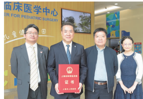
《小儿先天性心脏病介入诊疗体系的创建及关键技术的创新和应用》研究团队