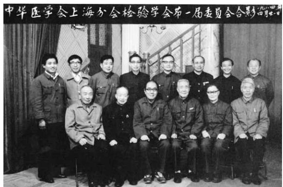
1984年4月21日中华医学会上海分会检验学分会第一届委员会合影

义学院接受知识分子改造,去农村巡回医疗接受知识分子改造。文革后迎来了事业发展的第二春。史博之主任是检验医学界的前辈,他勤奋的一生,严谨的工作作风和博学多才,为检验医学事业作出了奉献,识者莫不敬佩,更是我们学习的楷模。