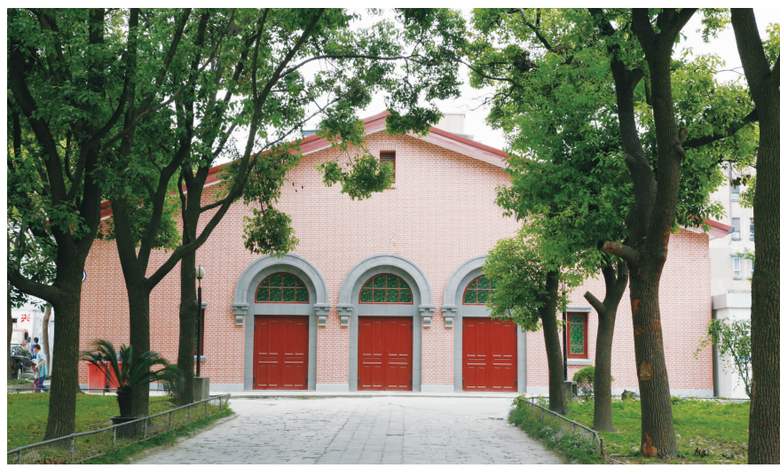
绿树掩映下的大礼堂就像一位淑女端庄大气(拍摄于2008年)

建筑是凝固的历史,是最为生动的讲述者。当我们徜徉在高楼林立的新华医院,如果说还要寻找那个火红的年代所留下的片砖片瓦,恐怕只有1958年10月4日新华医院举行盛大开业典礼的地方——江浦路1379号的上海市第四护士学校大礼堂。