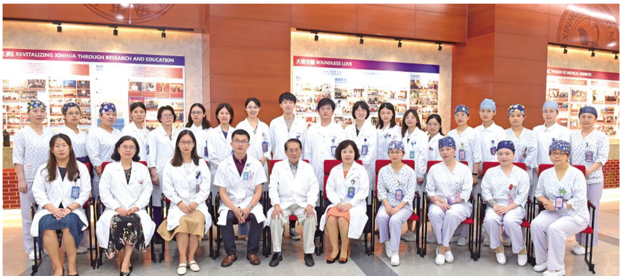
新华医院儿血液肿瘤科医护人员团队

我院是上海交通大学医学院儿科学院牵头单位,是国家重点学科(儿科学)、国家“双一流”建设重点学科、中国综合性医院儿科联盟牵头单位、首批国家级儿童早期发展示范基地。拥有17个独立行政建制的儿科学亚专业,为上海市儿科学研究所所在单位,拥有环境和儿童健康教育国家重点实验室、小儿消化和营养上海市重点实验室等研究机构。21世纪以来新华儿科共获国家科技进步二等奖5项,占据中国儿科学领域半壁江山。《把最好的留给孩子——新华儿童医院品牌介绍》专栏,为您展示这一个凝聚着新华儿科学人追求与爱心的品牌形象。