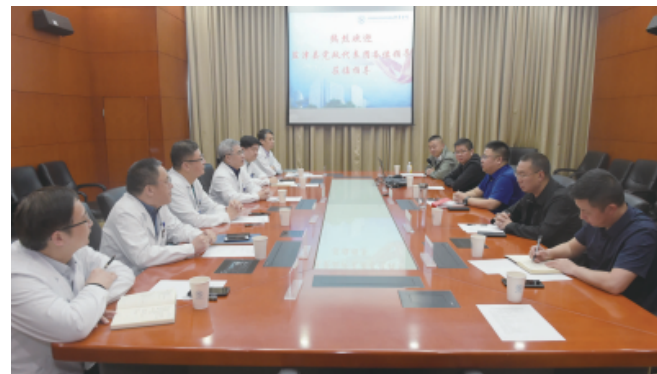
□ 通讯员 徐国峰 朱晋 报道

副院长程明表示:新华医院奉贤院区项目对新华医院意义重大,是新华医院“一体两翼、互联互通、平台支撑、学科融合”战略目标的关键所在。同时,奉贤院区对奉贤区域的民生关系重大,在建设过程中得到了奉贤区广大干部群众的热切支持,为建设团队提供了强大的动力。在建设过程中要做到理论联系实际,以问题为导向,学理论、强党性、立新功、见实效,相信在项目参建各方的通力合作下,一定能够圆满完成奉贤院区的项目建设工作。