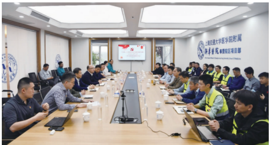
□ 通讯员 何双霞 左锋 报道

本报讯 5月6日,学习贯彻习近平新时代中国特色社会主义思想主题教育专题调研暨“双创优”工作系列活动——新华医院奉贤院区鲁班奖创建推进会议在新华医院奉贤院区项目部举行。