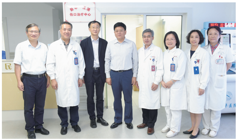
国家卫健委副主任王贺胜（左四）等一行来我院开展“新华-崇明区域医疗联合体”专项调研

最后，王贺胜副主任一行实地考察了新华医院新生儿病房、新华心脏医联体远程诊疗中心和新华-杨浦医联体江浦社区卫生工作站，对新华医院各项医联体工作成果及医务人员表示肯定和感谢。